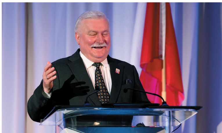
Były prezydent Polski Lech Wałęsa przemawia na bankiecie zorganizowanym z okazji wręczenia mu nagrody fundacji Abrahama Lincolna

Wałęsa, gorąco witany na bankiecie zorganizowanym z okazji